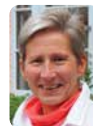
Claire de l'Eucharistie Cté des Béatitudes